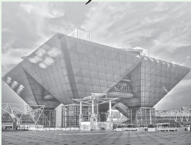
主催 株式会社高齢者住宅新聞社 後援 厚生労働省・国土交通省

7月27日(水)・28日(木) 会場：東京ビッグサイト東1ホール 時間：10時～17時(2日間共)