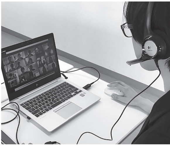
▲WEB会議を用いた集合研修の様子

アンケートは4月20日〜24日に実施。大手介護事業者8社に依頼し、学研ココファイン、セントケア・ホーム